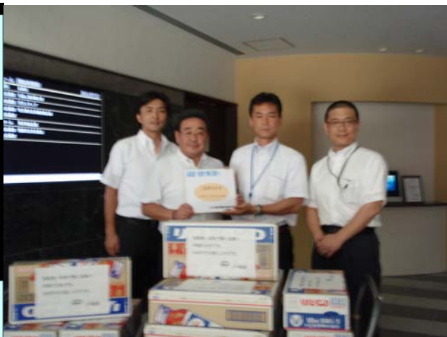
東電労組副委員長、書記長に物資を託す